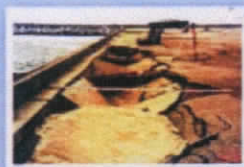
Piestātnes teritorijas iegrimes

Specīlas iekārtas (KF patenti №2098546, №2136812, №2098546)