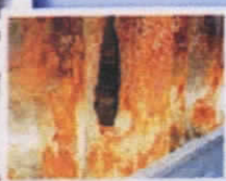
Ierievja korozijas bojājums